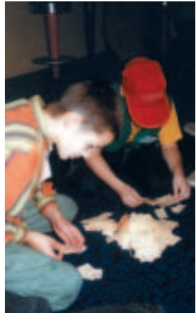
Die »Jury« zählt aus

Intern. Kinderfilmfestival »Schlingel« Zwickauer Straße 157 09116 Chemnitz