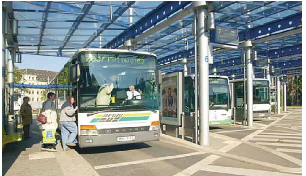
Der Chemnitzer Busbahnhof verfügt nicht nur über eine schöne Architektur, sondern ist auch ein bedeutsamer Knotenpunkt für den VMS in der Region.

Ab 1. November 2004 gibt es nach dem Beitritt der Städtische Verkehrsbetriebe Zwickau GmbH auch nur noch einen Tarif für alle 29 Verkehrsunternehmen in dieser Region. Das ist ein Umstand, den man vor zehn Jahren noch nicht für möglich gehalten hat. Der Anfang war nicht einfach zu meistern. Inzwischen ist man einen großen Schritt vorangekommen. Der Verbundtarif hat sich bewährt. Mit nur einem Fahrschein können in der gesamten Region alle Stadt- und Regionalbusse, Straßenbahnen und Züge des Nahverkehrs genutzt werden. Nichts ist so gut, dass man es nicht noch besser machen kann. Des-