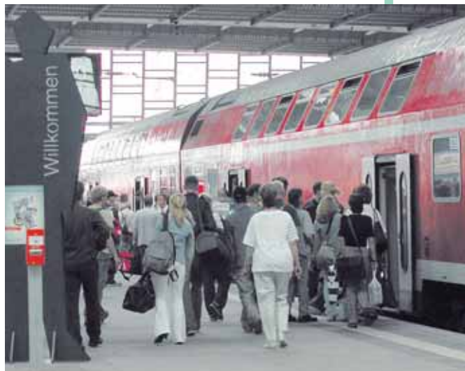
Bitte einsteigen! Alle Züge des Nahverkehrs können genauso wie Busse und Straßenbahnen mit dem VMS-Tarif genutzt werden.

dann, wenn nur Personen ab 15 Jahre gemeinsam unterwegs sind. Lassen Sie sich am VMS-Servicetelefon beraten. Alle Zeitkarten haben sich bewährt und werden weitergeführt. Somit können Wochen-, Monats- und Jahreskarten genutzt werden. Insbesondere für Senioren, die regelmäßig unterwegs sind, bietet sich die 9-Uhr-Monatskarte an. Diese, als auch die Monatskarte, gibt es im günstigen Abonnement. Der Vorteil für die Nutzer liegt darin, dass sie nur zehn Monate zahlen, aber 12 Monate fahren können. Außerdem werden die Fahrscheine direkt nach Hause geschickt. Ein weiterer Vorteil der Monats-, 9-Uhr-Monats und Jahreskarten im Normaltarif liegt in der Möglichkeit der Übertragbarkeit und vor allen darin, dass sie am Wochenende zu einer „Familientageskarte“ werden, denn es können bis zu sechs Personen, davon zwei nach dem 15. Geburtstag, mit ihr unterwegs sein. mü