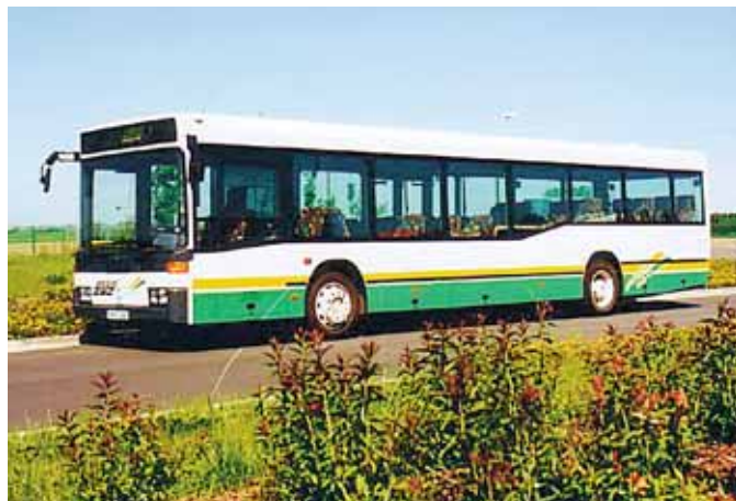
Die Ausflugslinie 642 bringt die Fahrgäste zu zahlreichen Sehenswürdigkeiten der Region.

Die aktuellen Fahrzeiten des Augustusburger sind erhältlich beim Service der CVAG unter Tel. 0371 2370333 und im Internet unter www.cvag.de .