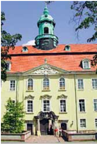
Schloss Lichtenwalde lockt mit seinen grünen Gärten.

Außerhalb von Chemnitz erreicht der Bus als Erstes das Schloss Lichtenwalde mit seinem idyllischen Barockgarten und fährt weiter nach Frankenberg. In dem Ort