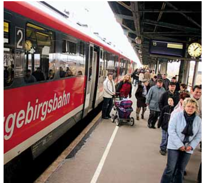
Die Verkehrsverbund Mittelsachsen bringt Sie komfortabel ans Ziel.

Die Gemeinde Niederwiesa und besonders der Ortsteil Lichtenwalde bestehen durch ihre attraktiven Sehenswürdigkeiten. In Lichtenwalde sind vor allem das Barockschloss mit dem großen Schlossgarten, der Barockgarten und die Orangerie als erste Ausflugsziele zu nennen. Aber auch das romantische Zschopautal mit seinen vielen Wanderwegen