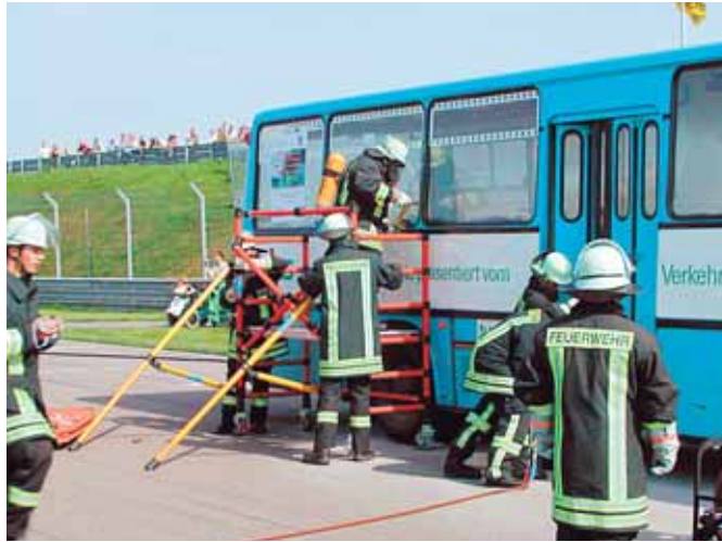
Die Bergung verunglückter Busse war einer der Höhepunkte des Verkehrssicherheitstages.

Auch einen Sonntag später, am 4. September 2005, bot der Verbundraum des VMS gute Unterhaltung: Das 6. Böhmisches-Sächsisches Eisenbahnfest, zu dem gemeinsam der VMS, die Erzgebirgsbahn, die BVO Bahn GmbH und die Tschechische Bahn ČD geladen hatten, lockte zahlreiche Gäste nach Oberwiesenthal. Bei herrlichem Sonnenschein erreich-