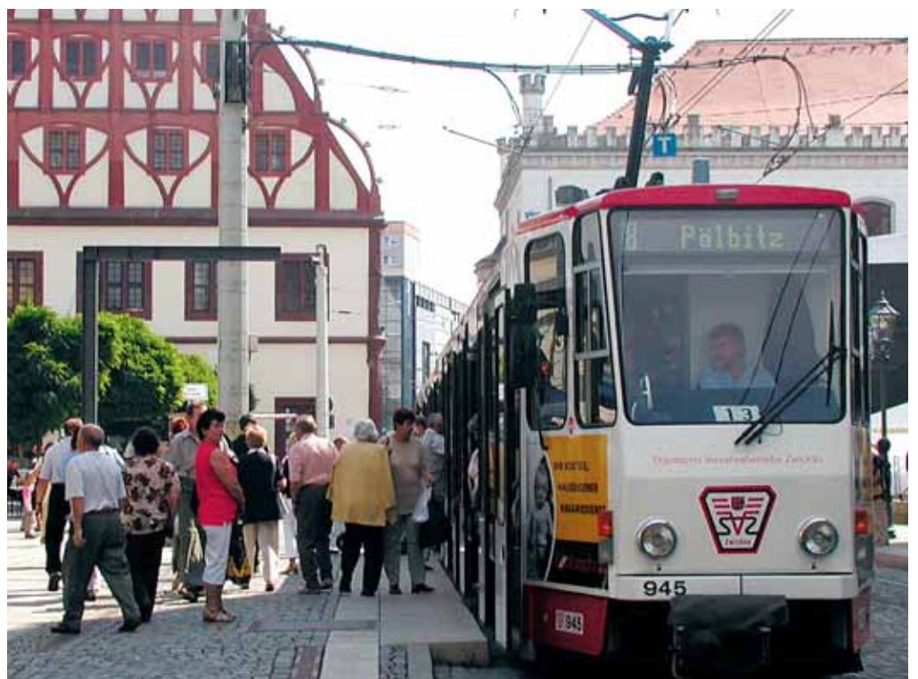
Die Tarifveränderung wird neben neuen Preisen auch neue Nutzungsmöglichkeiten bieten, die vor allem für Stammkunden Verbesserungen bringen.

Nicht nur jeder Pkw-Fahrer stöhnt über die steigenden Kraftstoffkosten, auch bei den öffentlichen Verkehrsmitteln wirken sich diese negativ auf die Kostenstruktur aus. Gründe für die bevorstehende Preisveränderung für einige Fahrscheine sind jedoch die von der Bundesregierung beschlossenen Kürzungen der Ausgleichszahlungen für den Schülerverkehr und die Beförderung Schwerbehinderter die 2006 zu Mindereinnahmen in Höhe von 1,6 Mio. EUR führen werden. Daraus resultieren notwendige Preisanpassungen. Die deutlichsten Veränderungen wird es bei der Kurzstrecke geben. Diese wird zukünftig 1,00 EUR kosten und statt der bisherigen 4 Haltestellen nur noch 3 Haltestellen im Regionalbus- und in den Stadtverkehren gelten. Die abweichende Gültigkeit bei der CVAG von 6 Haltestellen bleibt unverändert. Die „Erweiterte Kurzstrecke“ kostet ab 1. November 1,70 EUR und ist damit weiterhin attraktiv für kurze Fahrten über eine Tarifzongrenze. Der Preis der Tageskarte für eine Zone bleibt unverändert bei 2,90 EUR, wobei die Übergangslösung mit einem Sonderpreis für die Stadt Zwickau entfallen wird. Bei der Nutzung der Tageskarte über mehrere Zonen erhöht sich der Preis um jeweils 10 Cent. Auf vielfachen Wunsch unserer Fahrgäste wird es ab 1. November auch eine Tageskarte über 4 Tarifzonen zum Preis von 10,00 EUR geben. Die Preise der Fahrscheine für die „kleinen Stadtverkehre“ werden auf das Niveau des „Stadtverkehrs Freiberg“ angehoben. Eine Unterscheidung entfällt damit.