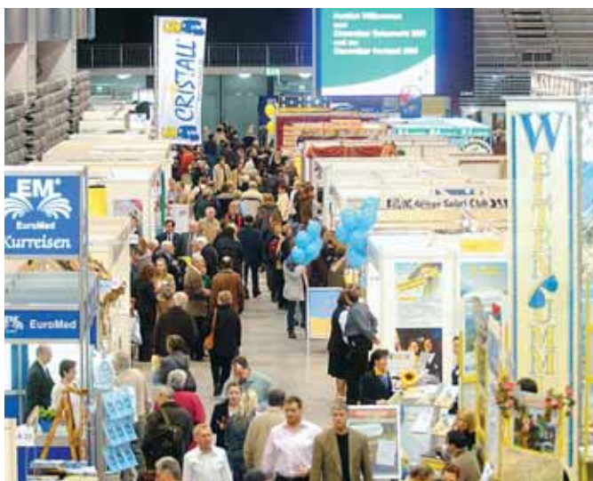
Schon 2004 fand das Messe-Duo erfolgreich in der Chemnitzer Messe Arena statt.

Ja sagen – egal, ob Reise oder Heirat – Chemnitz macht's vor. Bereits zum dritten Mal findet der Chemnitzer Reisemarkt gemeinsam mit der Hochzeitsmesse vom 6. bis 8. Januar 2006 in der Chemnitz Arena statt. Hatten im Januar 2005 bei der zweiten Messe schon über 200 Aussteller drei Tage lang für bunten Messtrubel gesorgt, so wird das Angebot im nächsten Jahr nochmals deutlich erweitert. Erwartet werden wieder Reiseveranstalter, Urlaubsregionen und Hoteliers aus ganz Europa. Wohnwagen- und Reisemobil-Händler bzw. -vermieter sind ebenso mit von der Partie. Messgäste können in Katalogen von Kinder-, Jugend-, Senioren-, Aktiv- und Kur-Reise-Anbietern stöbern oder aber kurzentschlossen ihren Traumurlaub gleich auf der Messe buchen. Der VMS ist erstmals auf dem Chemnitzer Reisemarkt und präsentiert sich dem neugierigen Publikum.