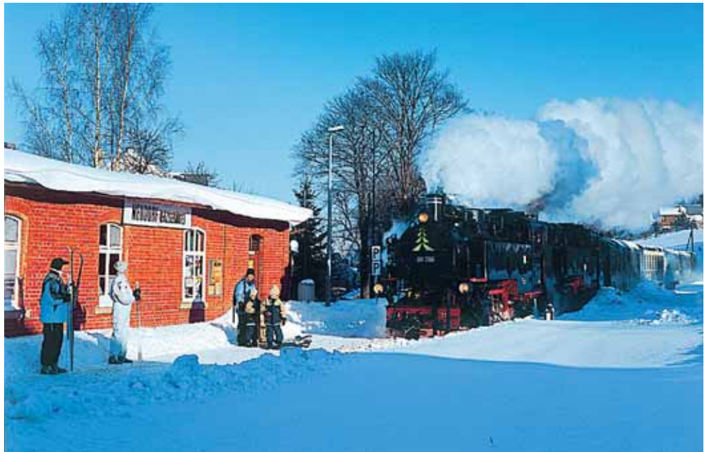
Der neue Fichtelbergexpress macht seinem Namen alle Ehre und befördert seine Fahrgäste zügig von Leipzig nach Oberwiesenthal.

Die letzte Rückfahrt beginnt im Kurort Oberwiesenthal 15:58 Uhr. Hier ist die Bahn sogar noch einen Tick schneller: 17:10 Uhr fährt der Zug in Cranzahl los und ist 20:01 Uhr in Leipzig. Das Umsteigen ist nur in Cranzahl erforderlich, sonst verläuft die Fahrt ruhig im modernen Triebwagen der