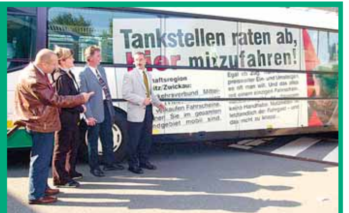
Die neue Buswerbung vom VMS.

karten sind im Vergleich zu den Kraftstoffkosten im Preis günstiger. Ein Pendler aus Stollberg, der zum Arbeiten nach Chemnitz fährt, spart bei einer zurückzulegenden Strecke von 26 km monatlich bis zu 15,00 EUR. Das macht im Jahr bis zu 180,00 EUR aus. Unter dem Motto „Cleverer als du denkst“ nutzen bereits heute viele Fahrgäste täglich Bus und Bahn im Nahverkehr im Verkehrsverbund Mittelsachsen!