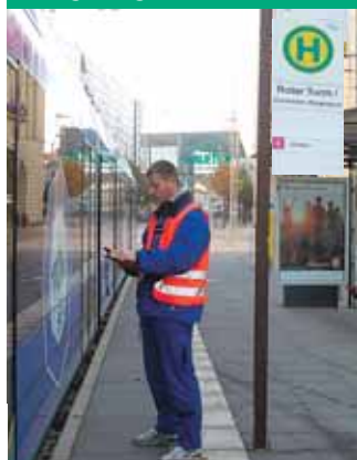
Die Mitarbeiter vermessen alle Haltestellen im Verkehrsverbund.

Seit September 2005 sind zwei Mitarbeiter des VMS unterwegs, um alle Haltestellen im gesamten Verkehrsverbund Mittelsachsen zu vermessen und die Koordinaten in ein Computersystem einzugeben. Die Messarbeiten sollen 2006 abgeschlossen werden. Ziel der Aktion ist es, den Fahrgästen und Touristen im VMS einen neuen Service zur Verfügung zu stellen, der die Orientierung erleichtern soll. Wer weder den Namen der Abfahrts- oder den der Ankunftshaltestelle kennt, kann die Adressen der jeweiligen Orte bei der Fahrplanauskunft angeben. Diese wird durch das neue System Auskunft geben können, wie man am Besten zu Fuß zur Abfahrtshaltestelle und von der Ankunftshaltestelle auf dem kürzesten Weg zum Ziel gelangt.