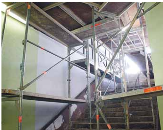
So wie hier am Südbahnhof arbeiten die Bahn-Mitarbeiter Wand für Wand an Chemnitzer Bahnhöfen.

Die herbstliche Farbaktion im öffentlichen Nahverkehr begann am Bahnhof Grüna. Weiter ging's im reichlichen Ein-Wochen-Takt an den Bahnhöfen Siegmars, Südbahnhof – hier waren die Streicherarbeiten durch die zwei Aufgänge etwas umfangreicher. Die Aktion, die