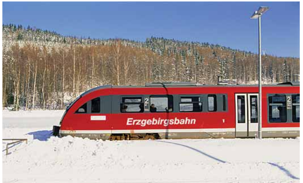
Mit der Erzgebirgsbahn bringt Sie der VMS sicher und pünktlich ans Ziel.

Um den Chemnitzer Stadtteil Reichenbrand besser anzubinden, verkehrt die Linie 253 zwischen Chemnitz, Schönau und Reichenbrand nun auf dem Linienweg der Stadtbuslinie 24 und bedient als zusätzliche Haltestellen Reichenbrand Brauerei, Friedhof und Kirche. Außerdem werden die Haltestellen Röntgenstraße, Zugang zur Pelzmühle, DRK Krankenhaus und Riedstraße angefahren. Die bisherige Haltestelle Pelzmühlenstraße wird nun durch die Stadtbuslinien 38 und 47, das Rabenstein-Center durch die Stadtbuslinie 38