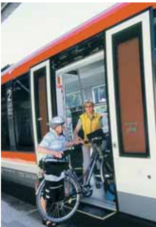
Mit Bus und Bahn lässt es sich im VMS bequem reisen.

... von Mittag weht es lau. Treffender wie das Volkslied kann man wohl kaum die ersten lockenden Sonnenstrahlen und das Erwachen der Natur beschreiben. Bei einem Ausflug in die Region lässt sich der Frühling besonders genießen. Viele Orte haben spezielle Veranstaltungen geplant, die Sie mit Bus und Bahn des VMS