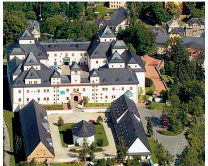
Wenn die Stadt Augustusburg ihren 800. Geburtstag feiert, gibt es auch im Schloss viel zu erleben.

bequem erreichen. Ein besonderes Jubiläum begeht die Stadt Augustusburg vom 25. bis 28. Mai 2006. Zu seiner 800-Jahr-Feier stehen Konzerte, Ausstellungen, Trödelmarkt, Modenschauen und Feuerwerk auf dem Programm. Den Höhepunkt stellt das historische Fest am Samstag und Sonntag mit Straßenmusikanten, Bettlern und Markttreiben dar. Zum Familientag am 3. Juni 2006 findet im Freizeitzentrum Augustusburg ein Fest mit Nachtrodeln an der Sommerrodelbahn statt. Als Spielzeugland im Erzgebirge ist auch Olbernhau bei den Kindern beliebt. Erwachsene fühlen sich von dem Museumskomplex Sailerhütte Grünthal mit seinem funktionstüchtigen Kupferhammer angezogen. Beim Olbernhauer Stadtfest am 17. und 18. Juni 2006 werden Groß und Klein abwechslungsreich unterhalten. Auch Bad Schlema ist in den Frühlingsmonaten ein