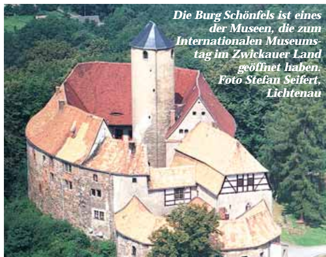
Die Burg Schönfels ist eines der Museen, die zum Internationalen Museumstag im Zwickauer Land geöffnet haben.

Museumsbesuch und Picknick im Wald teilnehmen. Treffpunkt ist 10:30 Uhr ab Bahnhof Reifland-Wünschendorf (Lengefeld). Die Anreise kann mit der Erzgebirgsbahn ab Chemnitzer Hauptbahnhof in Richtung Olbernhau erfolgen. Abfahrt ist in Chemnitz um 09:41 Uhr, Ankunft in Reifland-Wünschendorf um 10:22 Uhr. Es besteht die Möglichkeit, die Tour in Scharfenstein zu beenden (etwa 20 km) und mit der Bahn abzureisen. Wer möchte, kann wieder zurück nach Lengefeld laufen, die Tour endet dann wieder am Bahnhof (etwa 38 km).