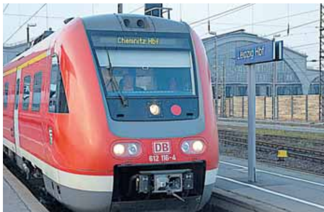
Der Regional-Express-Zug benötigt bald nur noch 53 Minuten von Chemnitz nach Leipzig.

nur die Pendler freuen, sondern auch alle Glücklichen, die eine Karte für ein Spiel der Fußball-WM in Leipzig gewonnen haben. Denn mit dem Zug ist man viel schneller als mit dem Auto und kommt viel entspannter an.