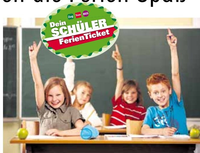
Wer hat Lust auf das SchülerFerienTicket?

Gültig ist das SFT in allen Straßenbahnen, Bussen, Nahverkehrszügen der Eisenbahnen und alternativen Bedienformen wie Anruflinien- und Anrufsammeltaxis der Verkehrsunternehmen des Verkehrsverbundes Mittelsachsen und des Verkehrsverbundes Vogtland. Weiterhin auf der Regionalbuslinie