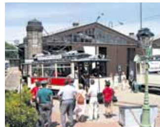
Straßenbahnmuseum Chemnitz

Chemnitz blickt auf eine reichhaltige 100jährige Geschichte der Rechen- und Computertechnik zurück. Am Beginn standen die ersten mechanischen Rechenmaschinen der Wanderer sowie der Astra-Werke mit den Markennamen Continental und Astra. Die Maschinen erledigten vor allem die wachsenden Aufgaben in Verwaltung und Büros. Dem Besucher wird in der neuen Sonderausstellung im Industriemuseum Chemnitz vom 16. Juni bis 9. September 2012 eine stattliche Ahnenreihe aus dem Zeitalter von Mechanik und Elektrik präsentiert. Herausragendes Exponat ist die legendäre Buchungsmaschine Astra/Ascota Klasse 170, gefertigt von 1955 bis 1983 in 332 742 Exemplaren und exportiert in über 100 Länder der Welt. Mehr Infos: www.saechsisches-industriemuseum.de