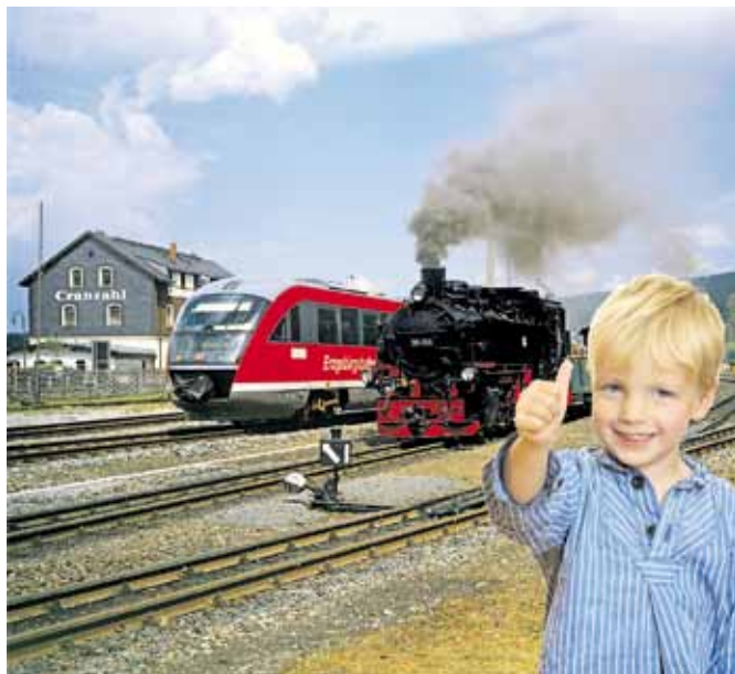
Ein buntes Programm für die ganze Familie haben die Veranstalter für das Festwochenende zusammengestellt.

einen Sonderfahrplan erarbeitet. Erwartet werden Eisenbahnsternfahrten nach Cranzahl mit modernen und historischen Fahrzeugen aus den Richtungen Chemnitz – Annaberg-Buchholz,