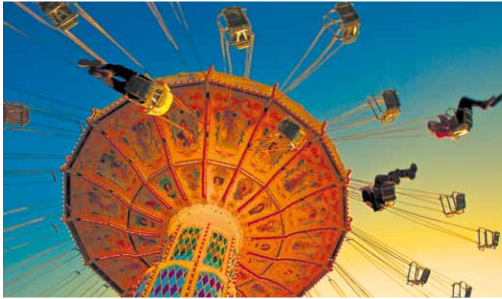
Die Annaberger Kät ist bei jung und alt sehr beliebt und hat eine lange Tradition.

In Annaberg-Buchholz kommen Sie mit den Stadtverkehrslinien direkt zum „Kätplatz“. Linie B ab Haltestelle „Busbahnhof“, Linie C ab Haltestelle „Wolkensteiner Tor“ (oberhalb vom Busbahn-