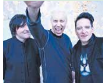
DIE ÄRZTE rocken am 27. Mai in der Chemnitzer Messe.

Auch zum Konzert DIE ÄRZTE am 27. Mai gilt das Kombiticket vier Stunden vor bis sechs Stunden nach Veranstaltungsbeginn. Für Ihre bequeme An- und Heimreise setzen wir an diesem Tag Sonderbusse der Messelinie M1 zum Hauptbahnhof Chemnitz ein. Die Haltestelle ist direkt vor der Chemnitz Arena. Gegen Vorlage Ihres Tickets können Sie die Sonderbuslinie M1 kostenfrei nutzen. Um 18:00 Uhr und 18:30 Uhr fahren ab Hauptbahnhof Chemnitz die Busse zur besten Band der Welt, zurück zum Hauptbahnhof geht's ab Chemnitz Arena kostenfrei um 23:15 Uhr und um 23:45 Uhr.