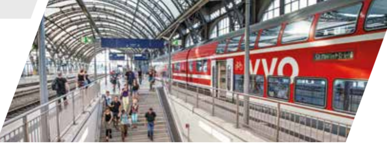
S-Bahn im Dresdner Hauptbahnhof

Weitere Informationen erhalten Sie bei den jeweiligen Bahngesellschaften sowie den InfoHotlines der Verkehrsverbände.