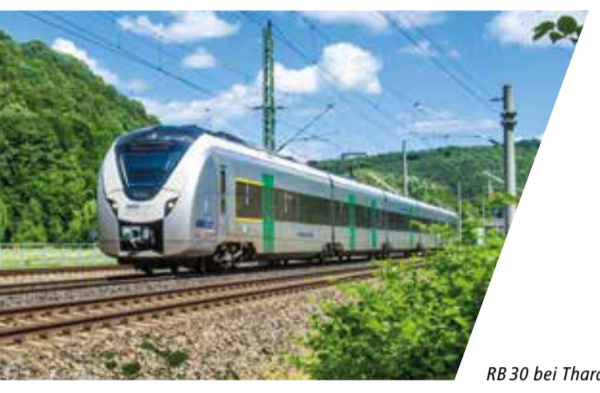
RB 30 bei Tharandt

Wir möchten Ihnen die Nutzung des öffentlichen Verkehrs so einfach wie möglich gestalten und verbessern die Anschlüsse zwischen Bus und Bahn, sorgen für ein einheitliches Tarifsystem, verständliche Informationen und kundenfreundlichen Service.