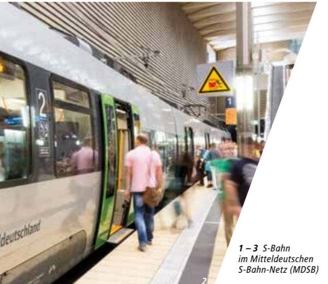
1 – 3 S-Bahn im Mitteldeutschen S-Bahn-Netz (MDSB)