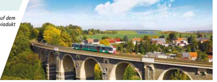
Citylink auf dem Bahrebachmühlviadukt