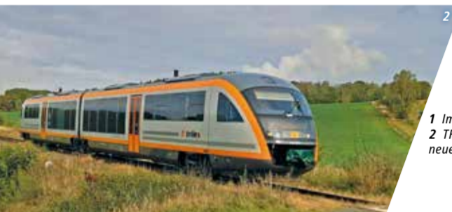
1 Im Zug der ODEG 2 TRILEX-Desiro im neuen Design unterwegs