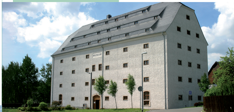
Das rekonstruierte Bergmagazin Zrekonstruovaná budova hornického špýcharu

Návštěvníci se seznámí s konstrukcí a způsobem práce přepravního zařízení, které dříve poháněli koně a které zde bylo v provozu mezi lety 1838 a 1877.