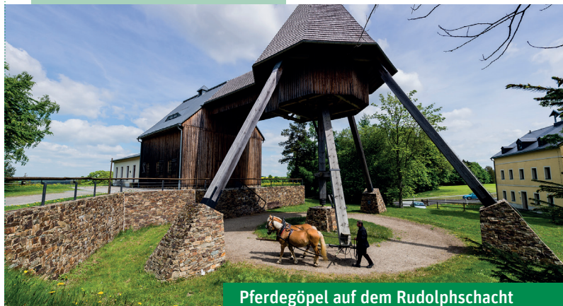
Pferdegöpel auf dem Rudolphschacht Koňský žentour u Rudolfovy šachty