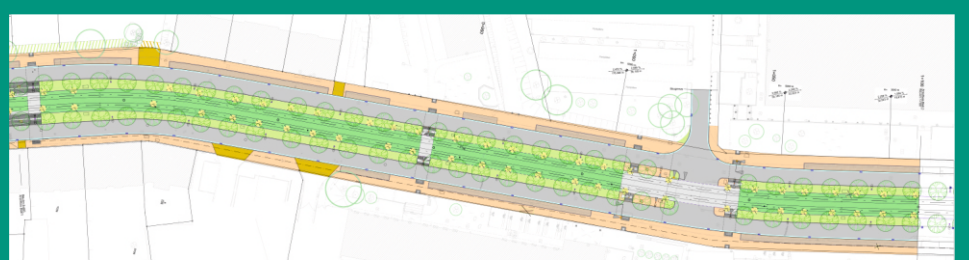
Reichenhainer Straße, Hst. Rosenbergstr. bis Campusplatz