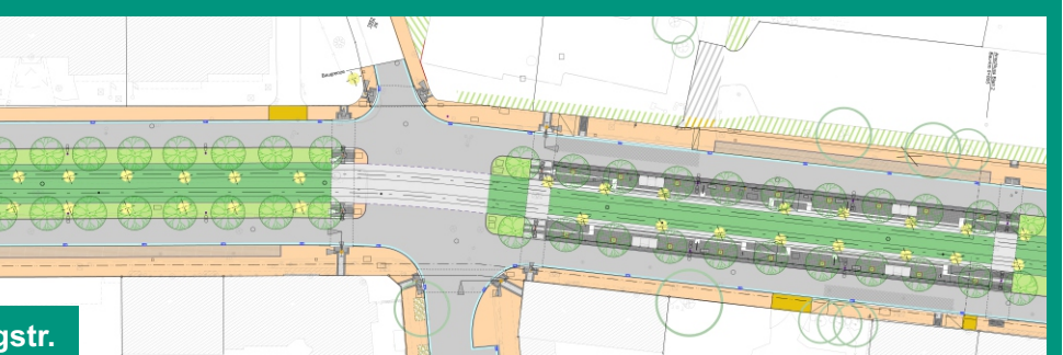
Reichenhainer Straße, Hst. Rosenbergstr.